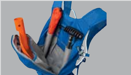
Bezpečnostní kapsa: sonda a lopata jsou bezpečně uloženy a snadno přístupné.