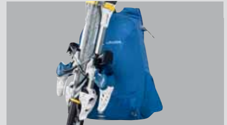
Diagonální uchycení lyží.