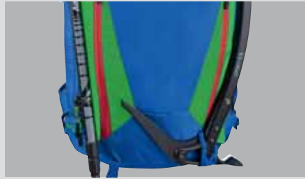
Praktické uchycení cepínů a/nebo hůlek.