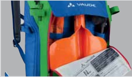
Bezpečnostní kapsa: sonda a lopata jsou bezpečně uloženy a snadno přístupné.