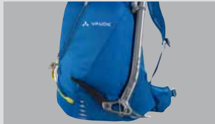
Praktické uchycení cepínů a/nebo hůlek.